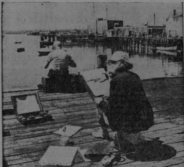
Cuando el clima es agradable, miles de norteamericanos salen en los fines de semana a dedicarse a la pintura, su pasatiempo favorito. Aquí, en Gloucester, Massachusetts, dos artistas aficionados pintan una escena marina.

El verano ha llegado a los Estados Unidos y, de la costa de Maine a los desiertos de Nuevo México y Arizona y los bosques de los estados del noroeste, cerca de tres millones y medio de norteamericanos lo aprovecharán para utilizar sus caballetes de pintura. Tal es el cálculo hecho por la Asociación de Vendedores de Materiales de Arte acerca del número de pintores aficionados dedicados en la actualidad a tan entretenido pasatiempo.